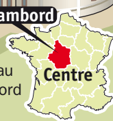
Le château de Chambord