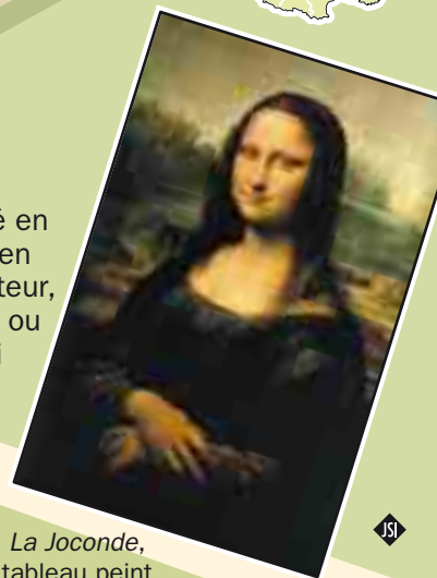
La Joconde , tableau peint par Léonard de Vinci

Léonard de Vinci est né en Italie en 1452 et mort en France en 1519. Sculpteur, architecte, dessinateur ou encore ingénieur, on lui doit de nombreuses inventions, mais aussi le célèbre tableau de La Joconde , exposé au musée du Louvre, à Paris.